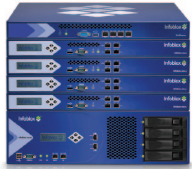
Gama de dispositivos Infoblox (de arriba a abajo) 250, 550-A, 1050-A, 1550-A, 1552-A y 2000

Más de 3000 empresas, entre las que se incluyen 12 de los 15 bancos líderes a nivel mundial, 3 de los 5 principales compañías distribuidoras y 6 de los 10 fabricantes internacionales más importantes, ya utilizan Infoblox para conseguir que sus redes sean más económicas y dinámicas, y que ofrezcan una mayor disponibilidad.